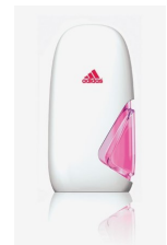
Parfum Adidas Ora Ito