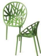
Chaises végétales Bouroullec