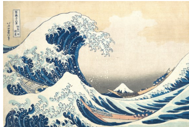
La vague Hokusai