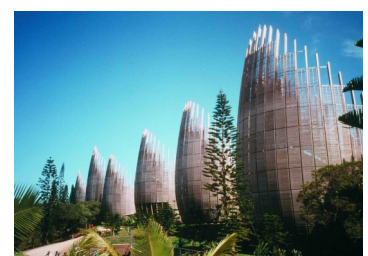
Centre culturel à Nouméa Renzo Piano