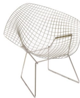
Diamond Chair Bertoia