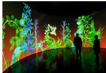
Art numérique Miguel Chevalier, Sur-Nature