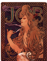
Affiche Job Alphonse Mucha