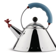
Bouilloire 9093 Michael Gaves