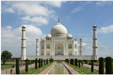
Le Taj Mahal

En abordant, découvrant et analysant des œuvres de l'histoire de l'art dans le monde.