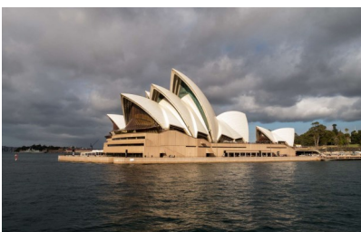
Opéra de Sidney Jorn Utzon