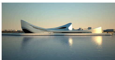
Musée de la méditerranée Zaha Hadid