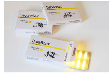
Installation Vaulot & Dyèvre, bora bora

Votre dossier doit s'inscrire impérativement dans l'un de ces trois champs.